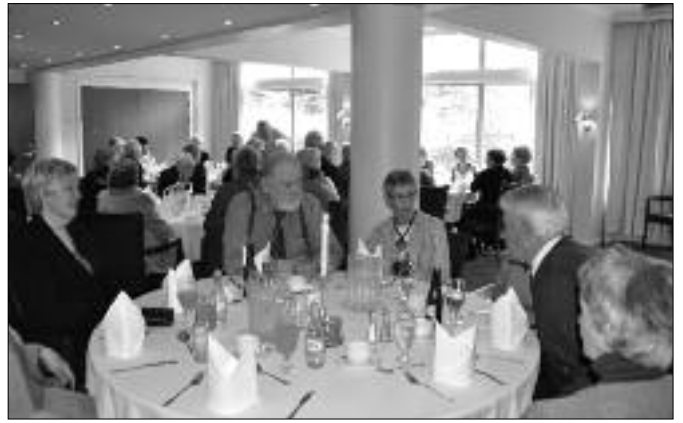
Døgurði áðrenn aðalfundin