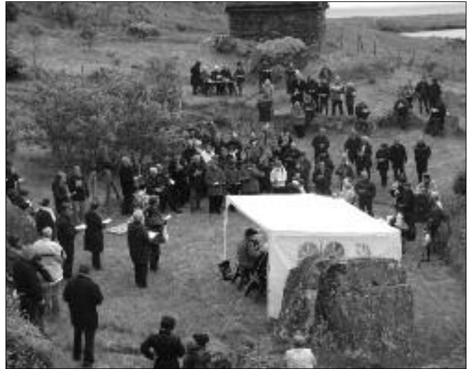
Hugnaløta í Múlavík

Umleið 150 fólk høvdu leitað sær oman í Múlavík í góðveðrinum hetta kvøldið, hýrurin var góður við nógvun prátið, so tað