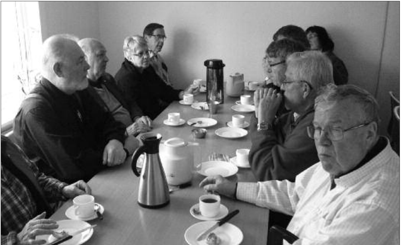
Morgunmatur á Húsum