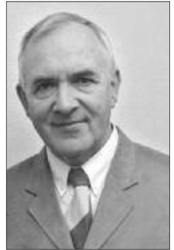
Svenning av Lofti

Skriftbrotini, ið sipað verður til, eru úr Jóhannesar evangelium 3. kapitli