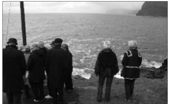
Útferð á Trøllanesi