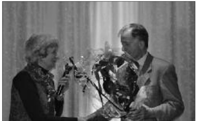
Inna handar fráfarandi formanninum blómur