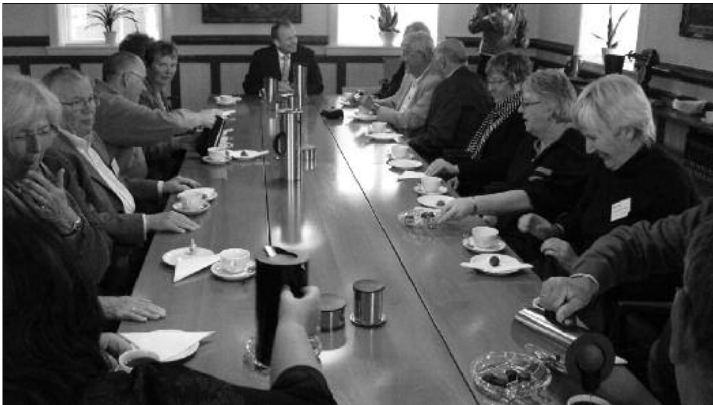
Á fundi í Tinganesi hjá lögmanni

Tann árliga fundin fyri norðurlenskar pensjónistar skipaði Landsfelagið fyri 23. – 25. mai. Gestir komu úr Finlandi, Svøríki, Noregi og Danmark. Tíverri eydnaðist ikki gestum úr Íslandi at koma vegna ring floglíkindi av øskuroki, síðsta ár mátti allur fundurin avlýsast vegna øskurok frá Eyjafjallajökul.